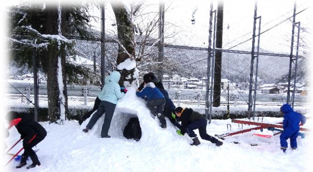
大きなかまくらで遊ぶ子どもたち

1月23日～27日までを給食週間として取り組みました。給食や食べ物に感謝しようということを行っています。「感謝」とは、「ありがとう」ということです。そういう気持ちを持つことが何より大切なのですが、思っているだけではなかなか伝わらないことが多いです。やはり、言葉で表すことや行動にうつすことが大切です。技労員さんは、学校の環境整備をするのが仕事です。仕事であるからやるのは当たり前。ですが、そのおかげで学校がきれいになったり、使いやすくなったりします。みんなのために仕事をしてきています。その技労員さんに、「ありがとう」と声をかけてくれる子どもがいます。教師が「感謝を伝えよう。」と言ったわけではなく自分で考え言葉を発してくれています。とても素敵だなあと感じます。学校には子どもたちが直接知らない方も来校されます。出会ったときにすぐに「こんにちは」とあいさつできる学校はとても気持ちがいいです。池内小学校もそんな学校であることを願っています。ちょっとした言葉でも、当たり前のことに感謝の気持ちが伝えられ、相手も自分も気持ちよく過ごせるそんな毎日を過ごしたいものです。2月も地域の皆様、保護者の皆様のご支援とご協力をどうかよろしくお願いいたします。