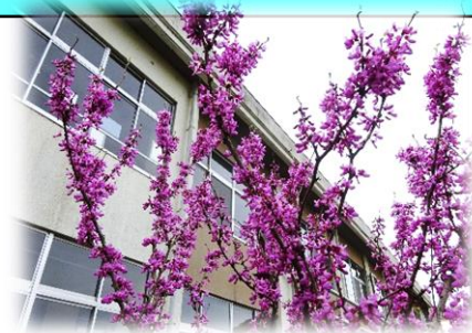
校舎北側のハナズオウ

ホームページは、こちらの QR コードを読み取っていただくか URL を入れてください。