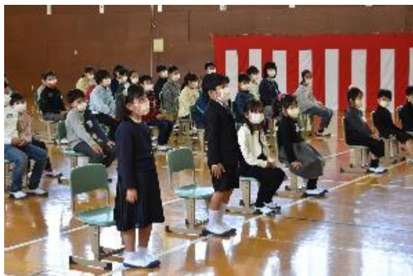
少し緊張気味でしたが、しっかり返事できました

4月11日(月)令和4年度入学式を行いました。今年度は8名の新1年生が入学しました。校庭の桜の花も満開に咲き、1年生を祝ってくれているようでした。また、天気も良く、入学式にふさわしい天候となりました。在校生も参加し、新しい仲間を迎えることができました。1年生の入学で、池内小学校の児童数は、昨年より少し増え、46名となりました。