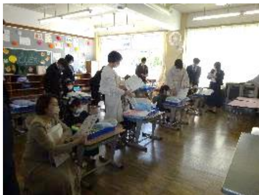
お家の方と教科書等の点検