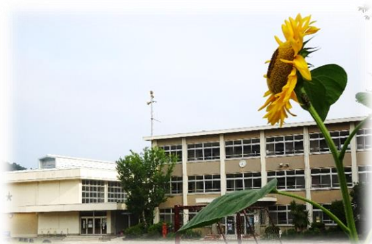
夏休み中に咲いていた ヒマワリ

ホームページは、こちらの QR コードを読み取っていただくか URL を入力してください。学校ブログを更新しています。ぜひのぞいてみてください。